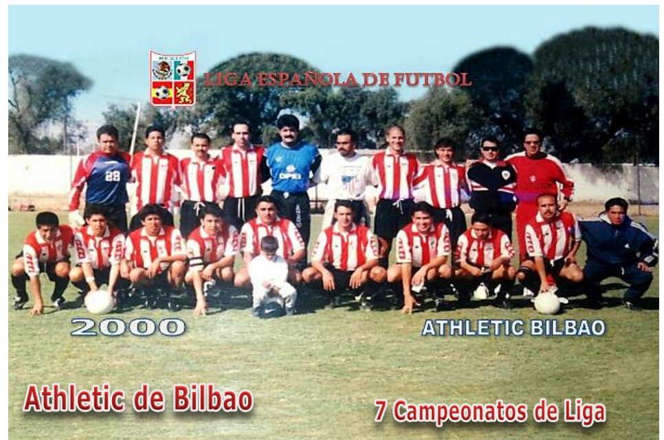
Athletic de Bilbao