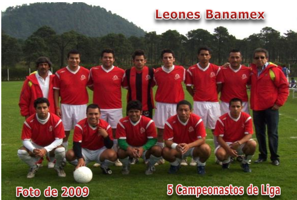
Foto de 2009