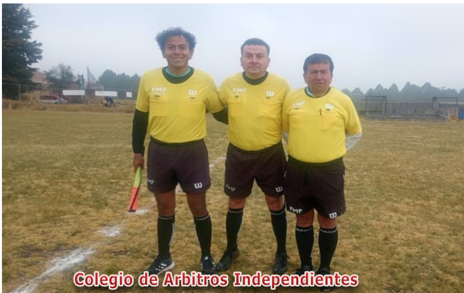
Colegio de Arbitros Independientes